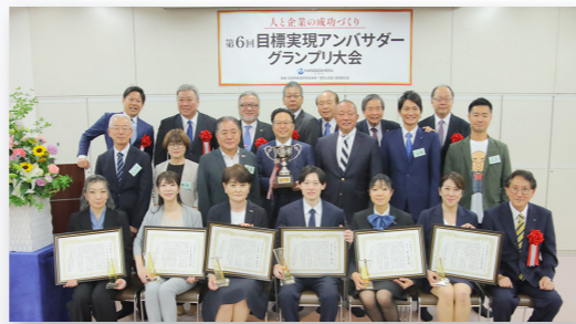
第6回「目標実現アンバサダーグランプリ大会」受賞者の皆様

可能思考セミナーSGA目標実現コースで設定した職場目標の達成度合いと実現までのプロセスを発表していただきます。