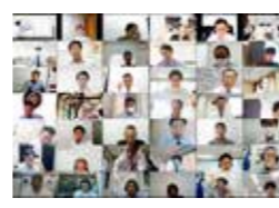
ディスカッションを通して新しい発見が得られます

全国からさまざまな業種の方がご参加されます。異業種の皆さんと学ぶことにより、今まで気づかなかった経営のヒントや発見が多くあり、いわゆる自社や業界の固定観念を打破していきます。