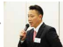
アドバイザーが親身になってサポートします

セミナー期間中、各グループには担当のアドバイザーがつき、受講生をサポートしていただけます。実務に役立つアドバイスや具体的な方法など、受講生に合わせたサポートがあり、業績アップに大いに役立ちます。