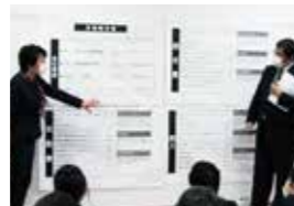
講義での説明をもとに自社分析を行います

決算書をご持参いただき、自社分析を行います。自社発展に必要な利益の額や、各経費の割合を分析します。これらの分析をもとに売上と経費削減の目標を設定し、業績アップに取り組めます。