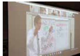
職場での取り組みを発表してアドバイスが得られます

業績アップの理論や具体的なノウハウを学び、職場で実践します。職場での実践を通してセミナー内容への理解を深めながら、自社の業績アップを図ります。