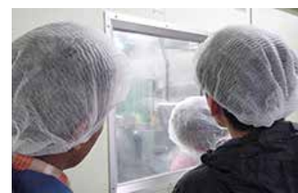
普段見ることのできない、異業種の製造過程

※コロナウイルス感染状況により、形態を変更して実施する場合もございます。あらかじめご了承ください。