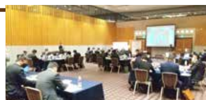
受講生の鋭い質問が講師の人生・経営の真理を引き出します

たっぷりとした質疑応答の時間を設けております。受講生の問題意識が講師の本音や熱意を引き出し、自社の経営のヒントを講師から聴くことができます。