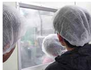
普段見ることのできない、異業種の製造過程

年に1~2社、共に学ぶ受講生の企業を訪問します。異業種・異業態の企業の現場には、日常では決して得られない貴重な情報や、自社の属する業界では考えられないようなノウハウがあります。それらを実際に見て体験し、自社の経営の視野と可能性を大きく広げます。