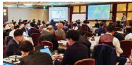
受講生の鋭い質問が講師の人生・経営の真理を引き出します