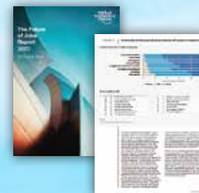
The future of jobs report 2020

世界経済フォーラムが発表した「The future of jobs report 2020」では、仕事の自動化・機械化の加速によって、8,500万の仕事が奪われ、人に求められる能力も大きく変わってくることが伝えられており、コロナ禍によって、その動きは前倒ししたとも言われています。雇用主が今後重要と見なすスキルのトップは、『問題解決能力』でした。また、経済産業省の『未来人材ビジョン』では、2050年の求められるスキルに『問題発見力』が上がっています。SGA目標実現コースでは、未来を見据えた人材を育成するため、問題解決能力と問題発見能力を磨くプログラムへと進化しています。