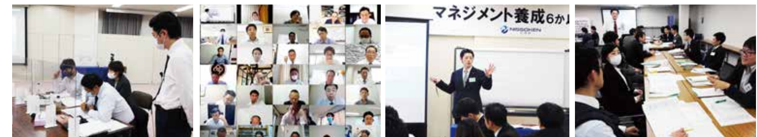
▲2020年 会場受講の様子 ※パネルと消毒液等を完備しています。 ▲オンライン受講の様子 ▶過去セミナーの様子