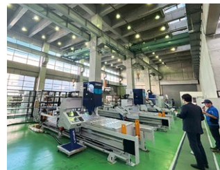
普段見ることのできない、異業種の製造過程

年に1~2社、共に学ぶ受講生の企業を訪問します。異業種・異業態の企業の現場には、日常では決して得られない貴重な情報や、自社の属する業界では考えられないようなノウハウがあります。それらを実際に見て体験し、自社の経営の視野と可能性を大きく広げます。