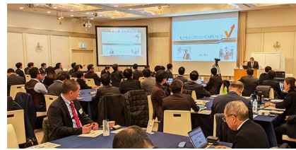
受講生の鋭い質問が講師の人生・経営の真理を引き出します

たっぷりとした質疑応答の時間を設けております。受講生の問題意識が講師の本音や熱意を引き出し、自社の経営のヒントを講師から聴くことができます。