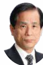
日創研 取締役 経営コンサルティング主任研究員 顧客業績対策メンバー 中小企業診断士