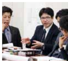
ディスカッションを通して新しい発見が得られます

全国からさまざまな業種の方がご参加されます。異業種の皆さんと学ぶことにより、今まで気づかなかった経営のヒントや発見が多くあり、いわゆる自社や業界の固定観念を打破していきます。