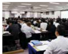
職場での取り組みを発表してアドバイスが得られます

業績アップの理論や具体的なノウハウを研修会場で学び、職場で実践します。職場での実践を通して研修内容への理解を深めながら、自社の業績アップを図ります。