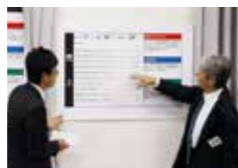
講義での説明をもとに自社分析を行います

研修に決算書をご持参いただき、自社分析を行います。自社発展に必要な利益の額や、各経費の割合を分析します。これらの分析をもとに売上と経費削減の目標を設定し、業績アップに取り組めます。