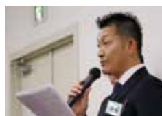
アドバイザーが親身になってサポートします

研修期間中、各グループには担当のアドバイザーがつき、受講生をサポートしていただけます。実務に役立つアドバイスや具体的な方法など、受講生に合わせたサポートがあり、業績アップに大いに役立ちます。