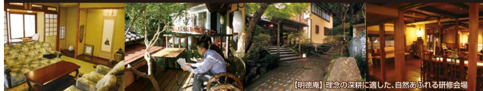
[明德庵] 理念の深耕に適した、自然あふれる研修会場

経営理念塾で学ばれた方のための経営理念に 命を吹き込むことを目的にした短期集中型のコースです