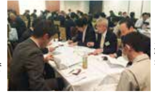
自分とは異なる意見、考え方、視点に触れ、新しい発想を生み出します

リラックスした雰囲気でのディスカッションをします。毎回グループが変わるので自分とは違う意見を多く聴くことができ、思考の枠を拡げることができます。