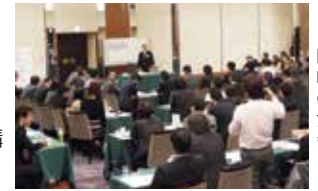
問題の解決策や戦略を討議し、それらの根底にある考え方や意図が理解できます

田舞塾の受講生全員で討議をします。なごやかな雰囲気の中で、講師と受講生が一体となって、問題の具体的解決策や今後の戦略を討議、提案します。