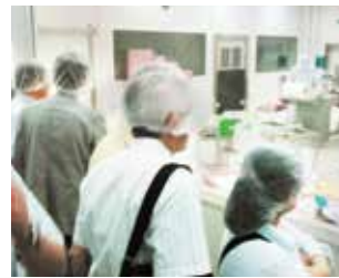
普段見ることのできない、異業種の製造過程