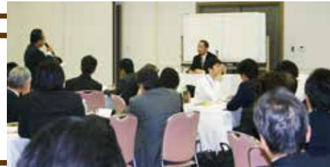
受講生の鋭い質問が講師の人生・経営の真理を引き出します

講演時間と同程度の時間を、この質疑応答に割きます。受講生の問題意識が講師の本音や熱意を引き出し、自社の経営のヒントを講師から聴くことができます。