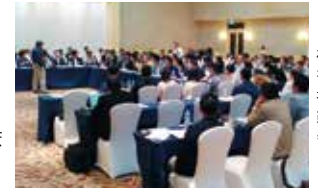
検証を行い分析力を高めることで、自社のビジョン構築、戦略立案に応用できます

ケース提供者によるビジョンや戦略の発表。受講生の疑問、質問にも答えま。ケース提供者の発表を聴いて、各自で実現の可能性を検証します。